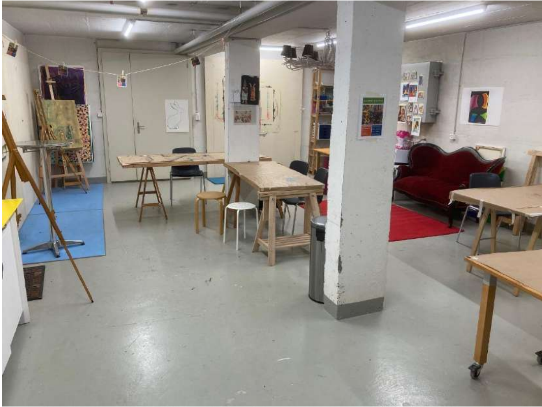
Malatelier UG (30m2)