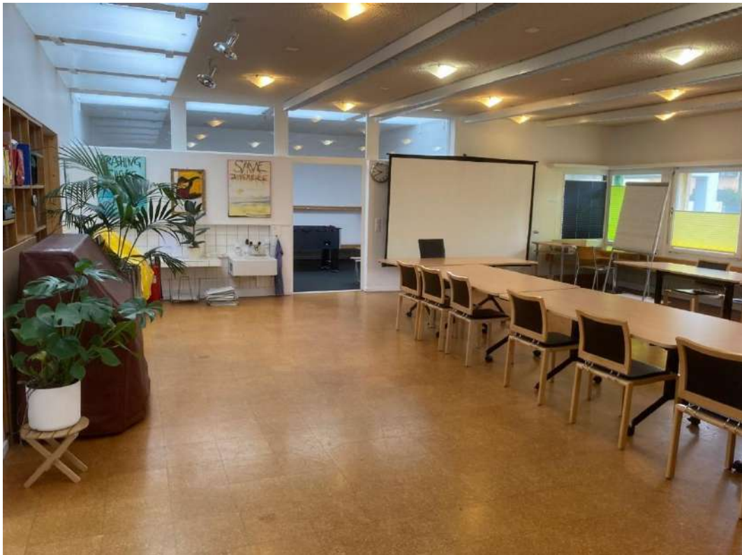
Kursraum mit Leinwand und Beamer und Flipchart – und Klavier