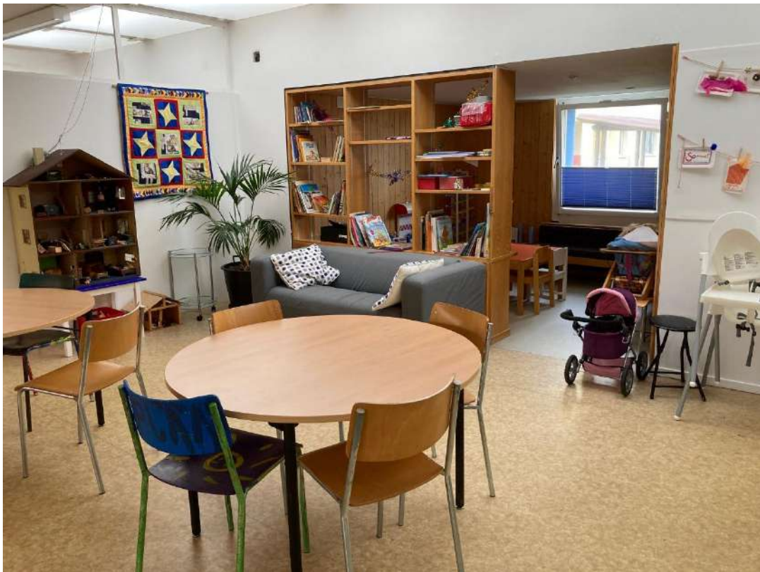
Spielraum mit Spielecke