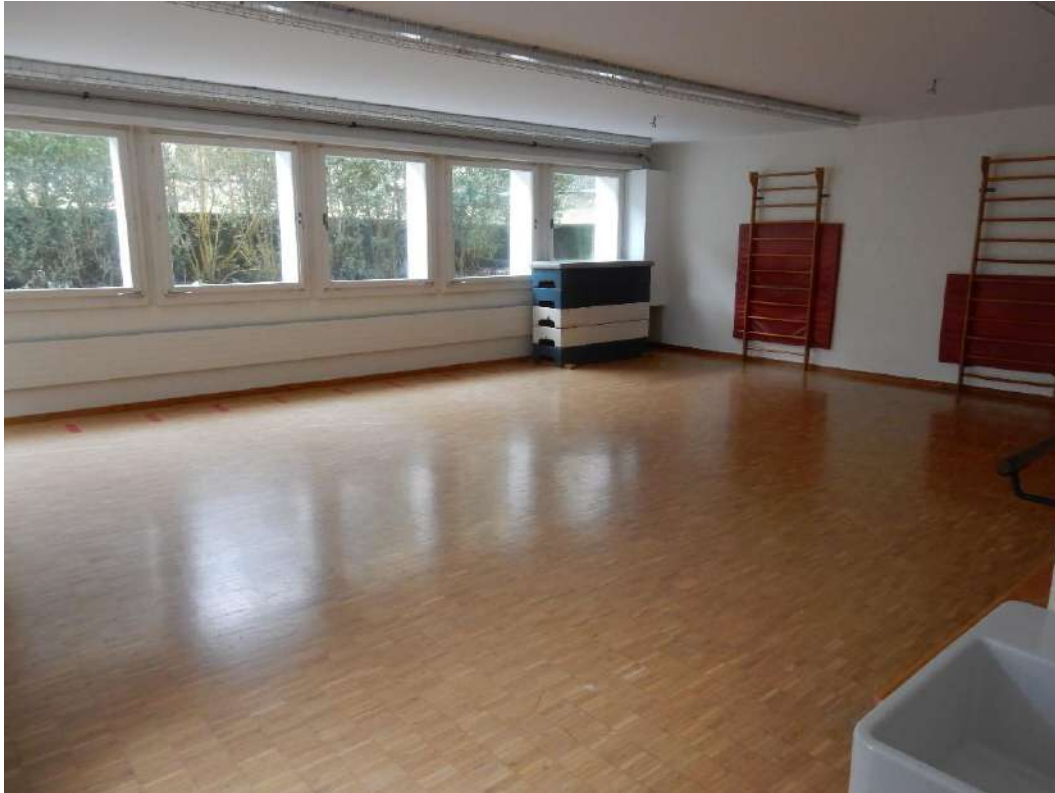
Gymnastikraum UG (64m 2 ) mit 2 Sprossenwänden, Holzbänken, grosser Matte, Bockelement und Ballettstange sowie Lavabo. Zwei WC im Gang.