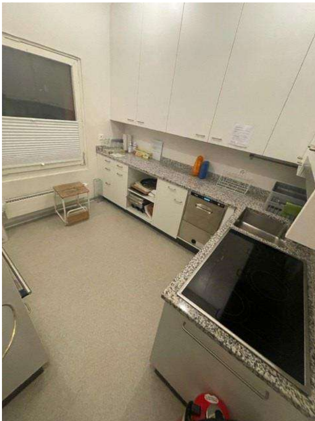
Küche 9m2 mit Geschirr/Besteck für 50 P.