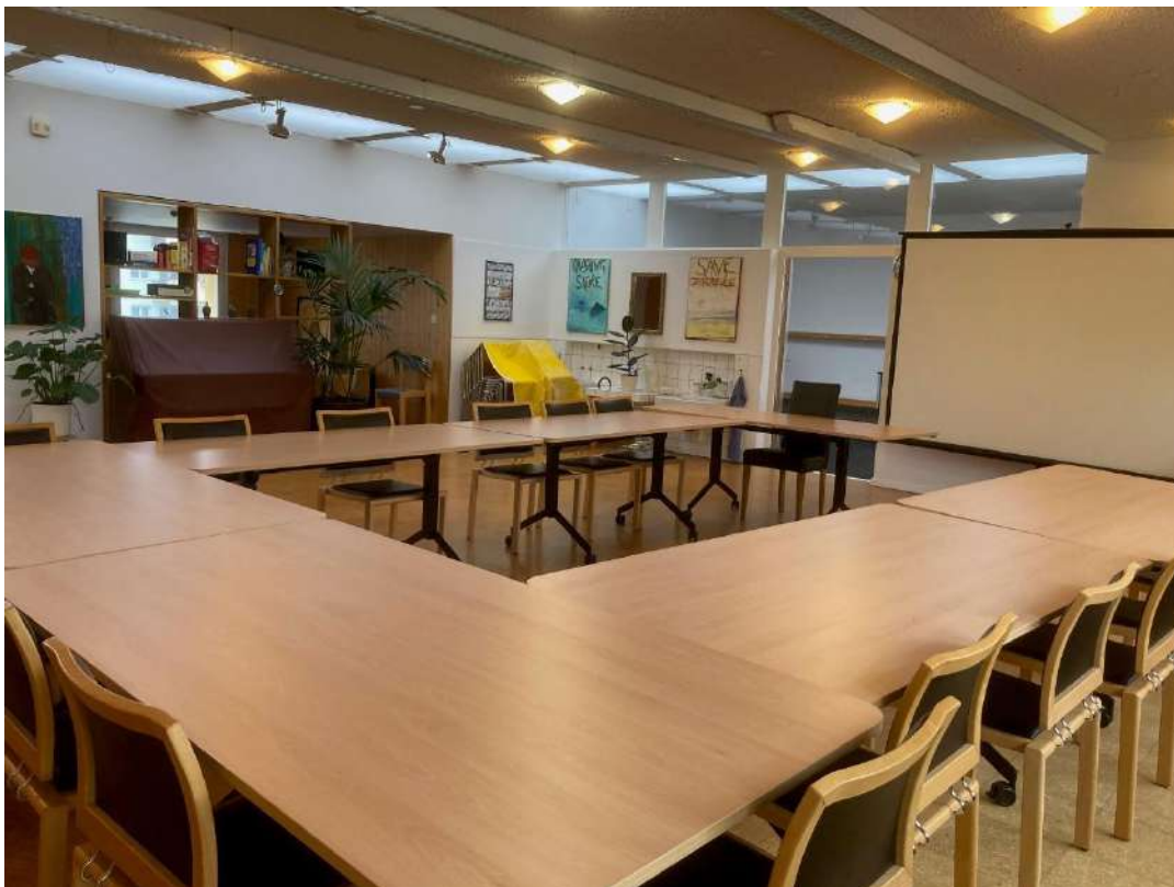
Kursraum 75m 2 (10 Tische und 50 Stühle für 50 P.)