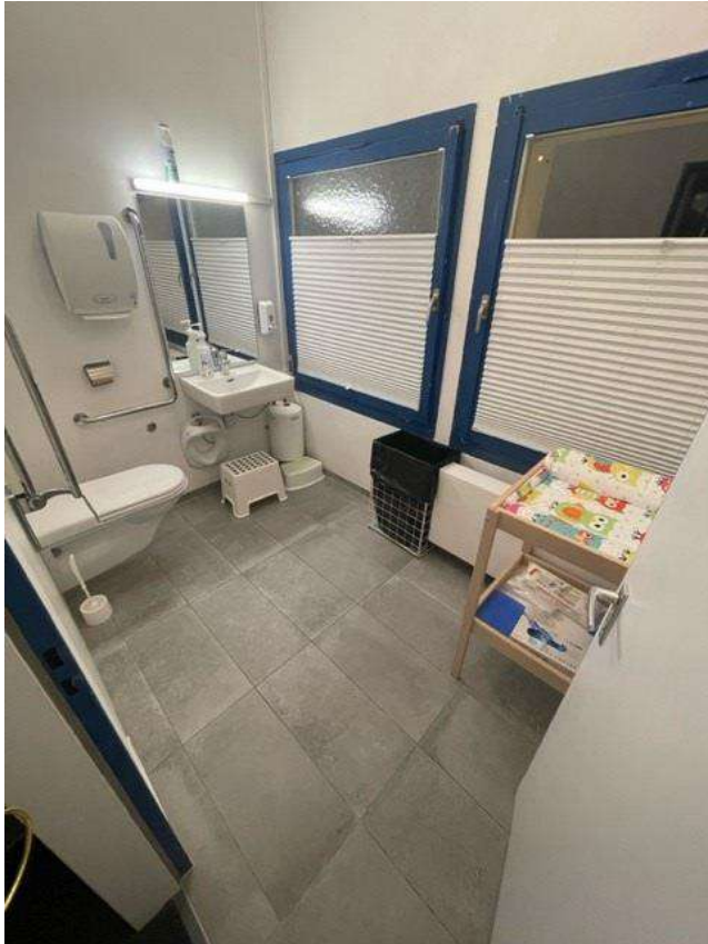
WC mit Wickeltisch (Rollstuhlgängig)