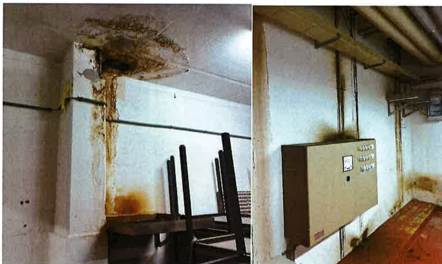
Abbildung 3: Wassereintritte im Untergeschoss