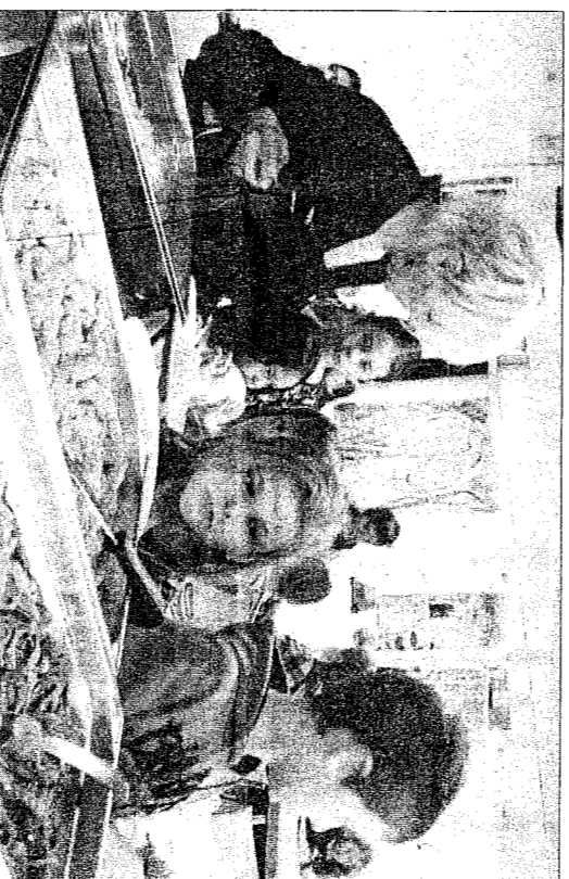
Die Mittagsbetreuung misamt Mittagessen erfreut sich grosser Beliebtheit.

Bis 11.45 Uhr werden dort die Vorbereitungsarbeiten erledigt. Wer ist krank gemeldet? Steht etwas Ausserordentli-